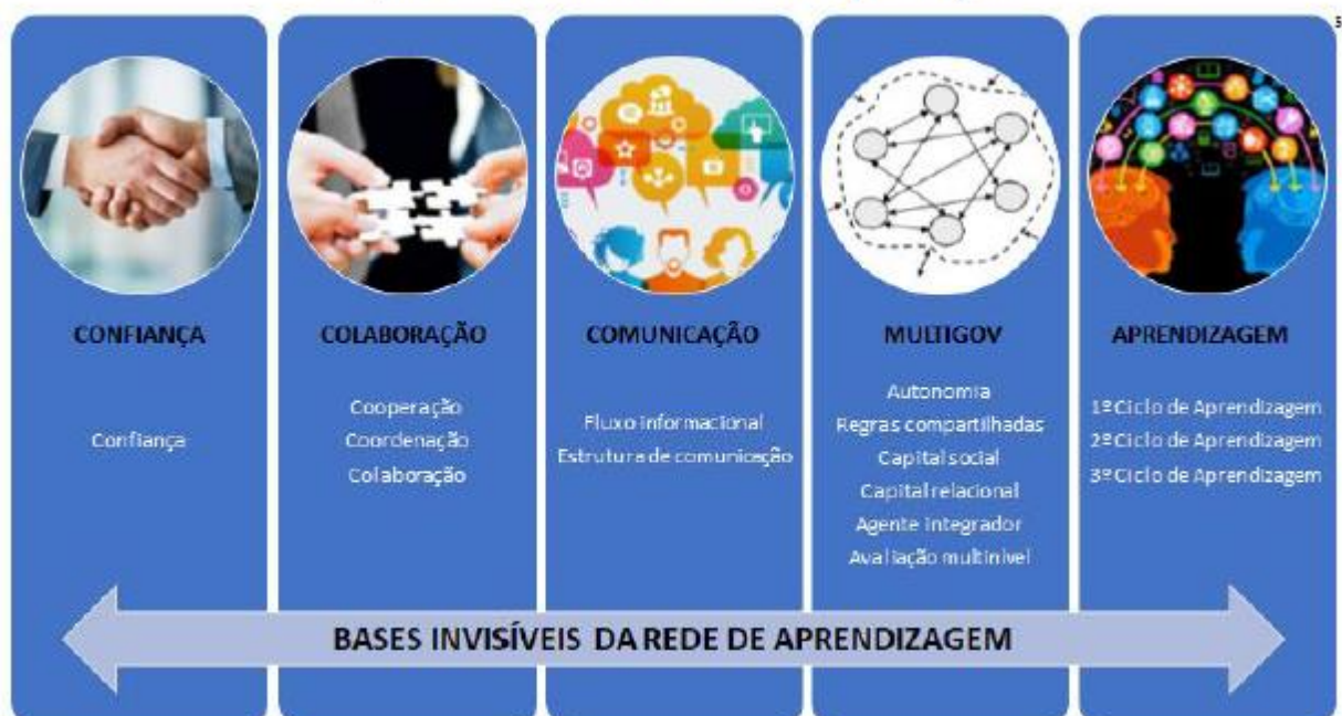
Figura 2: Bases Invisíveis da Rede de Aprendizagem

A governança de redes ocupa-se das relações sociais entre atores formalmente independentes, mas funcionalmente interdependentes, que se organizam em torno de um objetivo comum. Nas redes de aprendizagem esse objetivo é a aprendizagem em e na rede.